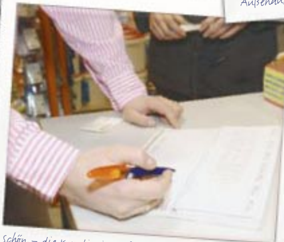
Schön – die Kundin ist zufrieden und hat sich für ein Gartenhaus aus der Ausstellung entschieden. Für den nächsten Schritt machen wir einen Termin aus.