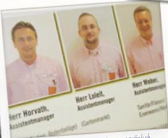
Wir sind für unsere Kunden da – immer persönlich ansprechbar und die Kunden wissen, mit wem sie es zu tun haben.