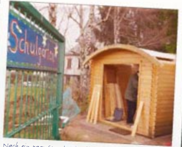
Nach ein paar Stunden ist die Hütte von den Eltern und vom HORNBACH-Team fast fertig aufgebaut – bald können die Kinder spielen.