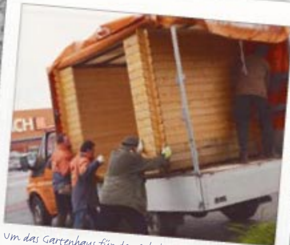
Um das Gartenhaus für den Schulgarten aufzuladen, ist echte Maßarbeit erforderlich – Zusammen bekommen wir die Hütte schon rein.