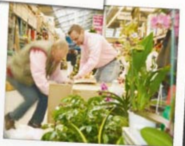
Schnell mal eben mit angefasst.